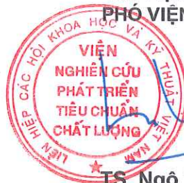
TS. Ngô Tất Thắng