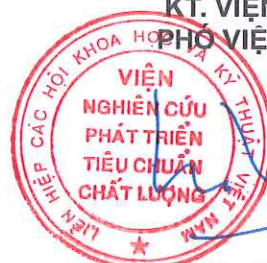
TS. Ngô Tất Thắng