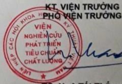
TS. Ngô Tất Thắng