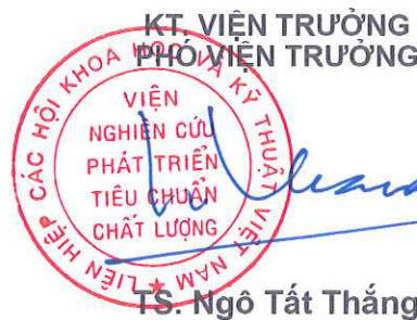
TS. Ngô Tắt Thắng