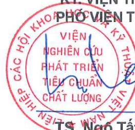
TS. Ngô Tất Thắng