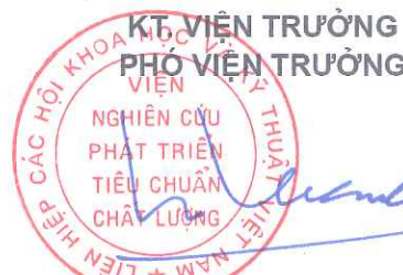
TS. Ngô Tất Thắng