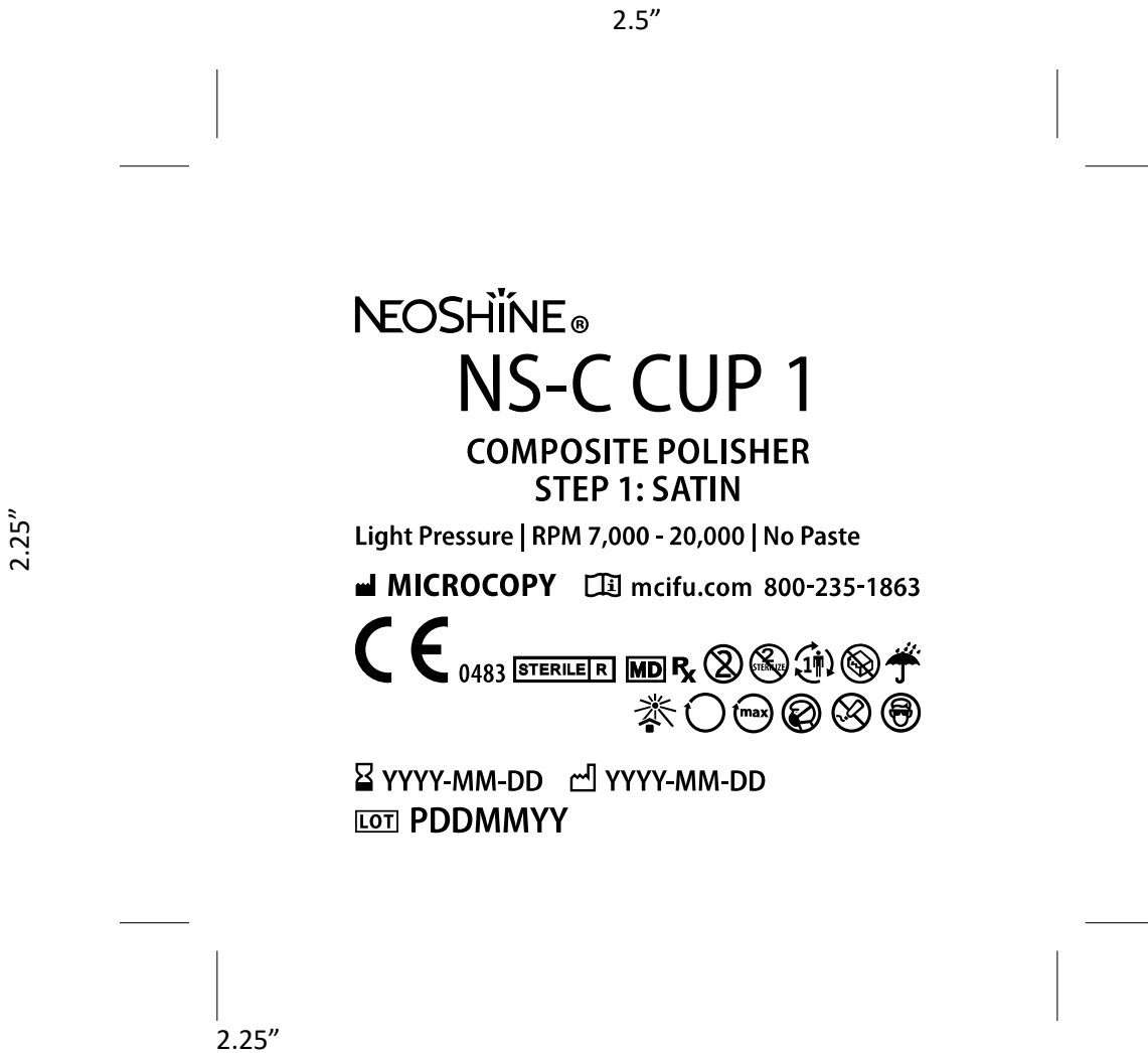
Figure: NeoShine Composite Cup 1 Pouch Design*