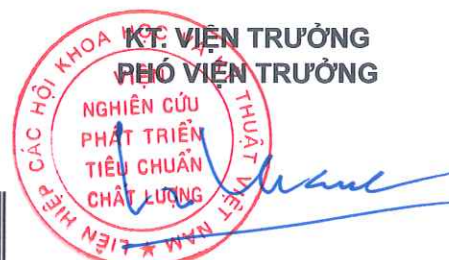
TS. Ngô Tất Thắng