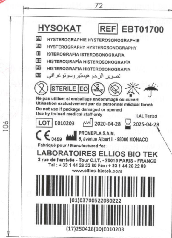
Etiquette produit 1 Product Label 1

-ATTENTION: Date de péremption de 5 ans -WARNING: 5 years use-by date