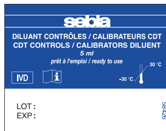
Diluant contrôles / calibrateurs CDT CDT controls / calibrators diluent