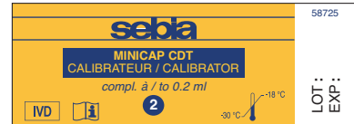
Calibrateur 2 / Calibrator 2