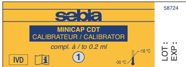
Calibrateur 1 / Calibrator 1