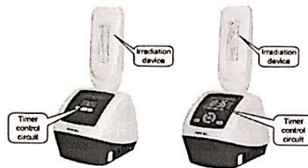
Figure 2-1 KN-4006A/KN-4006B Figure 2-2 KN-4006AL/KN-4006L