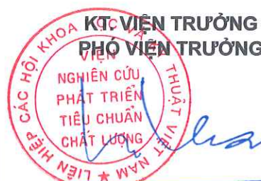
TS. Ngô Tất Thắng