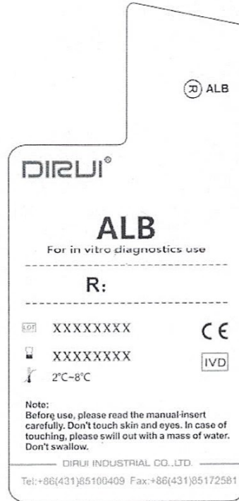
Tem nhãn trên chai