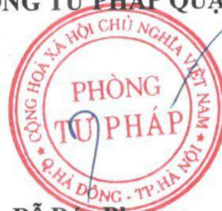
Đỗ Đức Phương