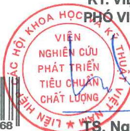
TS. Ngô Tất Thắng