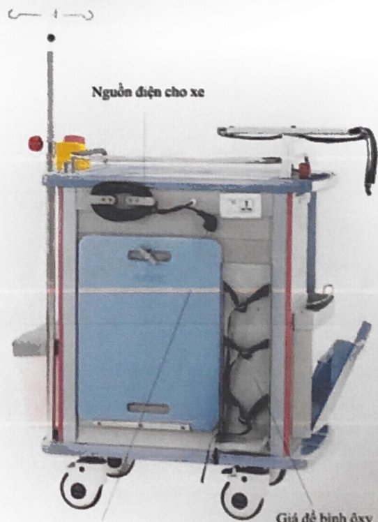
Nguồn điện cho xe