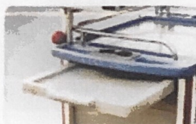
Khay trượt ngang