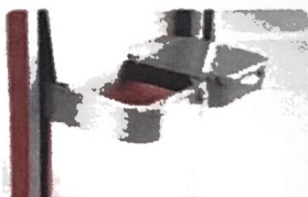
Dụng rác, vật tư tiêu hao đã sử dụng