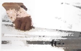
Khay để thuốc có thể di chuyển được