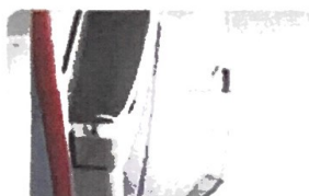
Ngăn đựng tài liệu